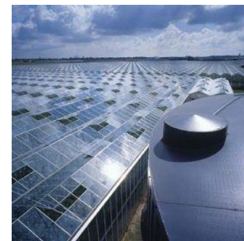
Energoefektīvas "zaļās" ēkas