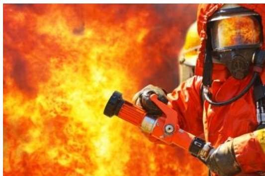
Karstumizturīgi formas tērpi